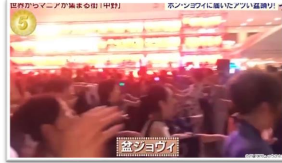
□アド街ック天国 / テレビ東京