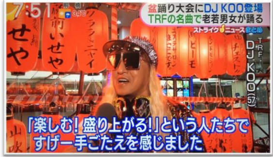
□グッド! モーニング / テレビ朝日