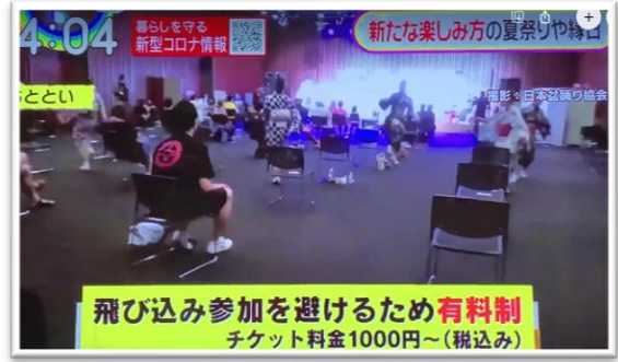
□Oha! 4 / テレビ朝日