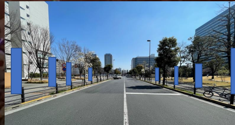
【A】沿道のぼり設置イメージ