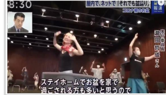
□あさチャン / TBS