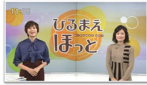
□ひるまえほっと / NHK