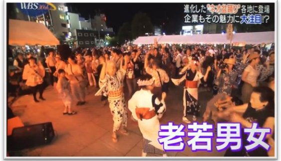
□ワールドビジネスサテライト ／テレビ東京