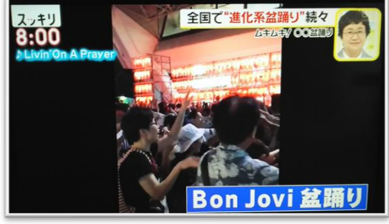
□スッキリ / 日本テレビ